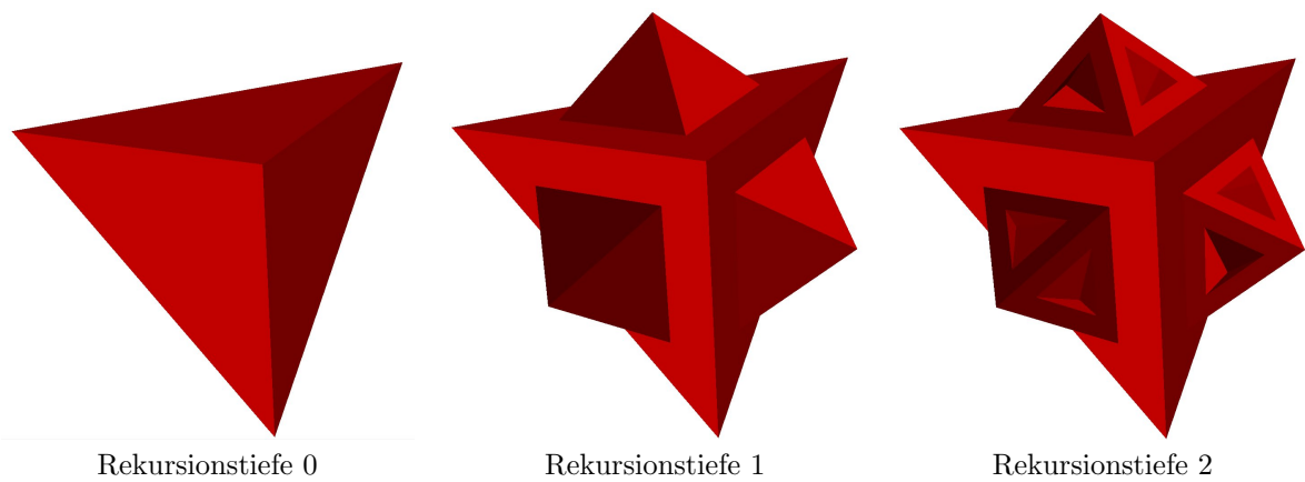
Abbildung 2: Beispiel wie das Ergebnis aus Teil b) aussehen soll